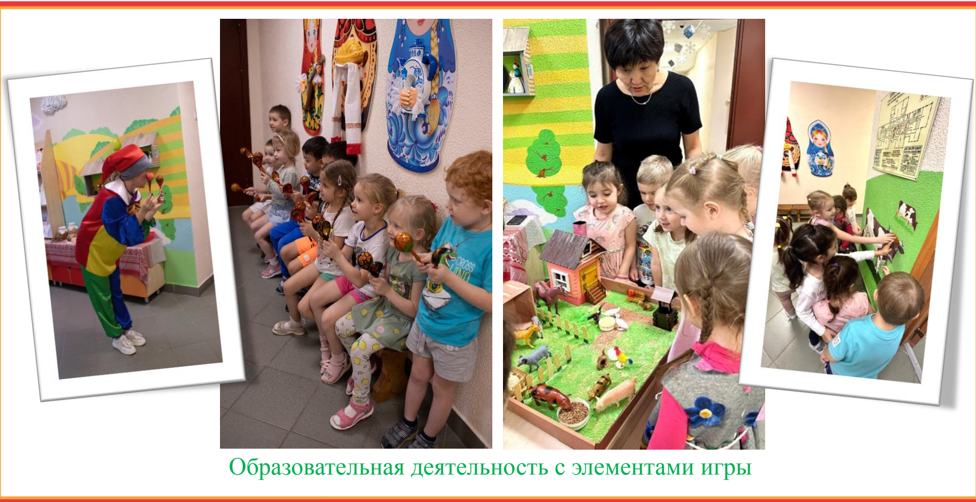
Образовательная деятельность с элементами игры