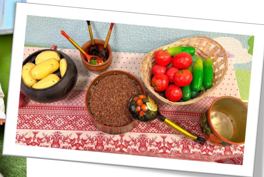
Наш мини-музей не такой как все!