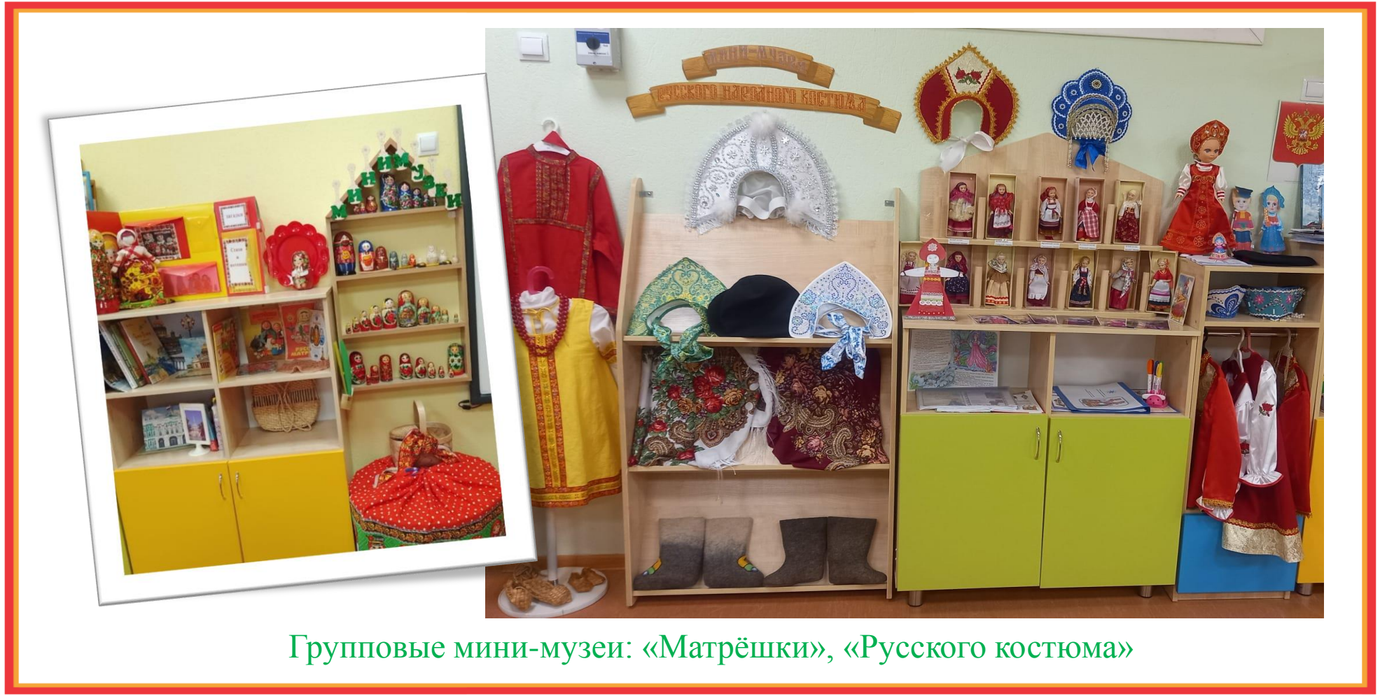
Групповые мини-музеи: «Матрёшки», «Русского костюма»